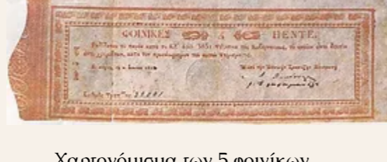
Χαρτονόμισμα των 5 φοίνικων του 1831