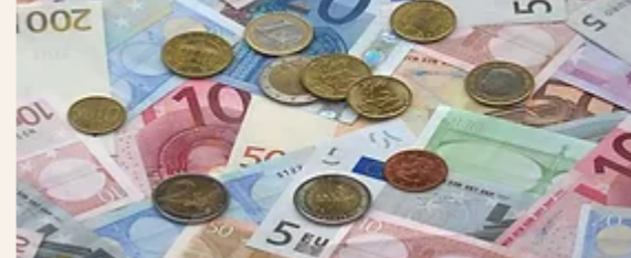
Κέρματα και χαρτονομίσματα ευρώ διαφόρων ονομαστικών αξιών