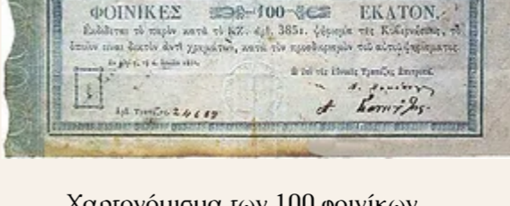
Χαρτονόμισμα των 100 φοίνικων του 1831

Την εποχή του Όθωνα καθιερώθηκε πια ως εθνικό νόμισμα η Δραχμή. Το καινούργιο νόμισμα έλαβε την ονομασία του από τη Δραχμή της αρχαιότητας, ενώ δανείστηκε τις παραστάσεις του από τα νομίσματα των ευρωπαϊκών βασιλείων. Η Δραχμή της νεώτερης εποχής ήταν επίσης από άργυρο. Αποτελείτο από εννέα μόρια καθαρού αργύρου και ένα μόριο χαλκού. Ζύγιζε 4,029 γραμμάρια καθαρό ασήμι και 0,448 γραμμάρια χαλκό. Η Δραχμή κυκλοφόρησε σε μία σειρά από αργυρά νομίσματα των μισής, μιας και πέντε Δραχμών, καθώς και χάλκινα κέρματα των 1,2,5 και 10 λεπτών.